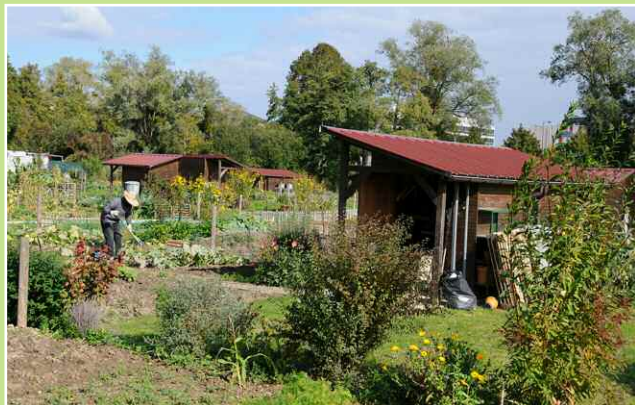
Jardinage au sein des jardins familiaux