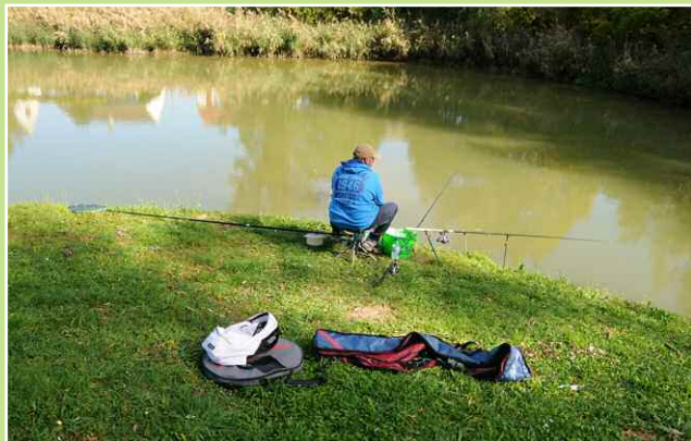
Pêche dans les étangs