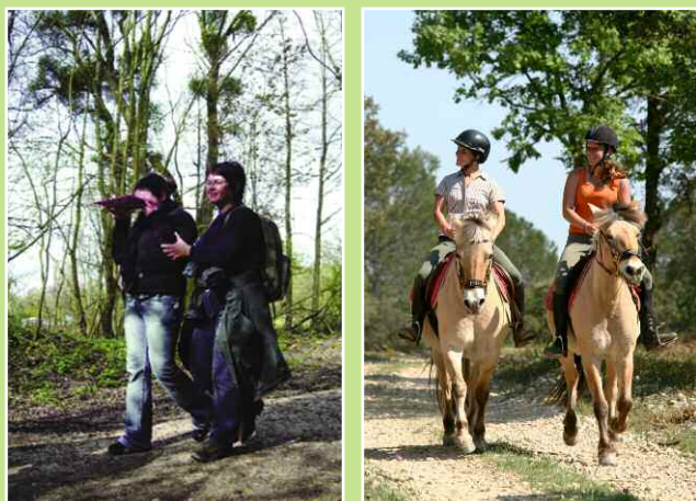
Promenade à cheval ou à poney

Découverte de la nature à travers des visites à thème, pour les petits comme pour les grands.