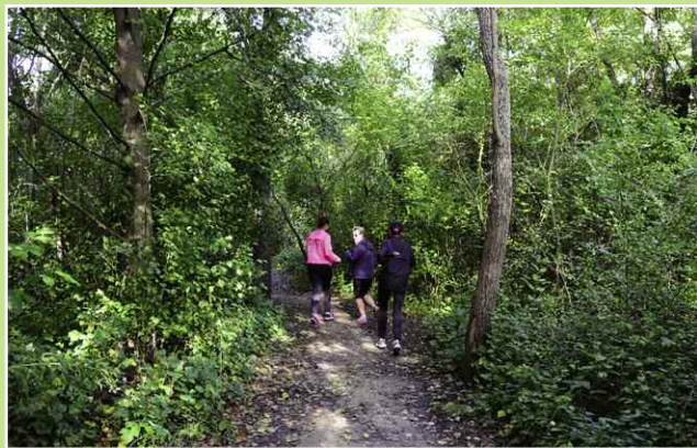
Parcours sportif à pied ou à vélo

Au-delà des différentes promenades sur les sentiers du parc, ces 150 hectares de verdure offrent de nombreuses possibilités de loisirs dans le respect de la nature :