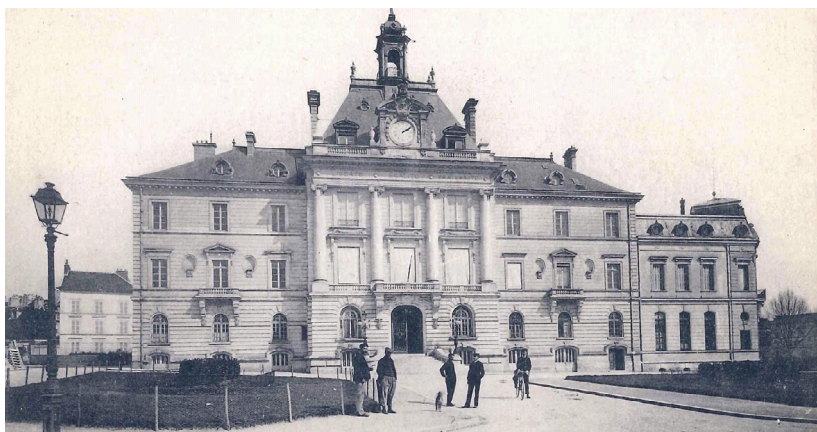
Hôtel de Ville, début du 20 ème siècle