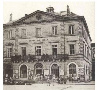
Hôtel de Ville, entrée et façade principale sur l'actuelle place Henri Moissan, 1833-1893