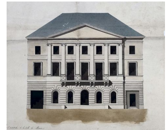
Pierre Didier Prosper SAVARD, Projet pour l'élévation de la façade de l'Hôtel de Ville, 1826

Pour en savoir plus sur l'histoire et l'aménagement de l'Hôtel de Ville et découvrir le bâtiment en vous amusant, rendez sur notre site ville-meaux.fr , rubrique culture → Archives municipales → Archives et Histoire de Meaux → Histoire, aménagement et architecture de l'Hôtel de Ville.