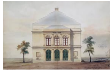
Alexandre Bourla, Premier projet pour l'élévation principale, dessin, 1840, 555 x 625 mm

Suite au succès du cinématographe inventé par Louis Lumière en 1895 et à la démocratisation des projections cinématographiques, M. Catriens, alors concessionnaire du théâtre, propose dès 1913 l'installation d'une salle dédiée uniquement aux projections cinématographiques (plan 12). Face au coût d'une telle opération et suite au déclenchement de la première Guerre Mondiale, le projet ne verra finalement pas le jour. Le théâtre est alors renommé "Théâtre des variétés" ainsi que "American Cinéma Music-Hall", preuve de son succès populaire.