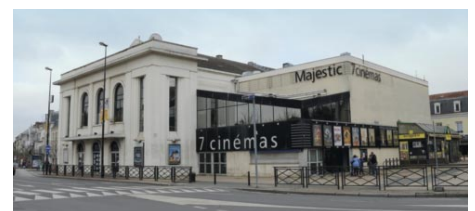
UGC Majestic, février 2019

Devenu vétuste, le théâtre sera entièrement rénové à partir de 1933 pour prendre la forme que nous lui connaissons aujourd'hui. Il deviendra ainsi le "Cinéma Théâtre Majestic" avant de laisser place dans les années 50 uniquement au cinéma "Le Majestic" puis aujourd'hui au "UGC Majestic".