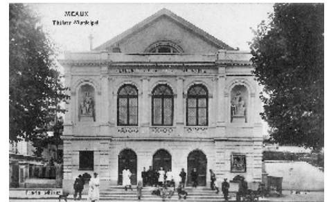
Le théâtre municipal, carte postale, 1910-1920