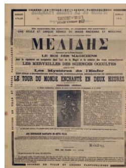
Programme des représentations aux Théâtres de Meaux (19 e siècle)