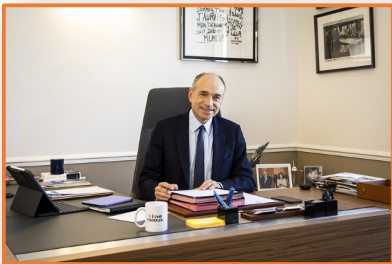
Jean-François Copé Ancien Ministre, Maire de Meaux, Président du Pays de Meaux